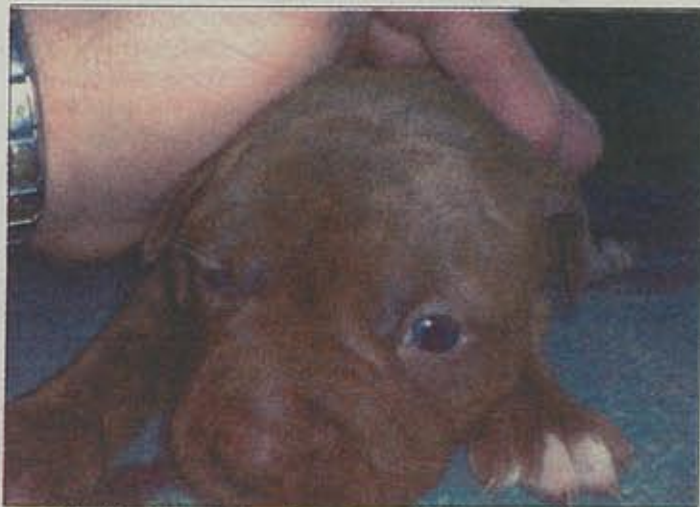
De Pitbull is één van hondensoorten die als gevaarlijk ras bestempeld is. Op de foto een puppy van dit hondenras.

Volgens mij is het belang dat op de eerste plaats zal