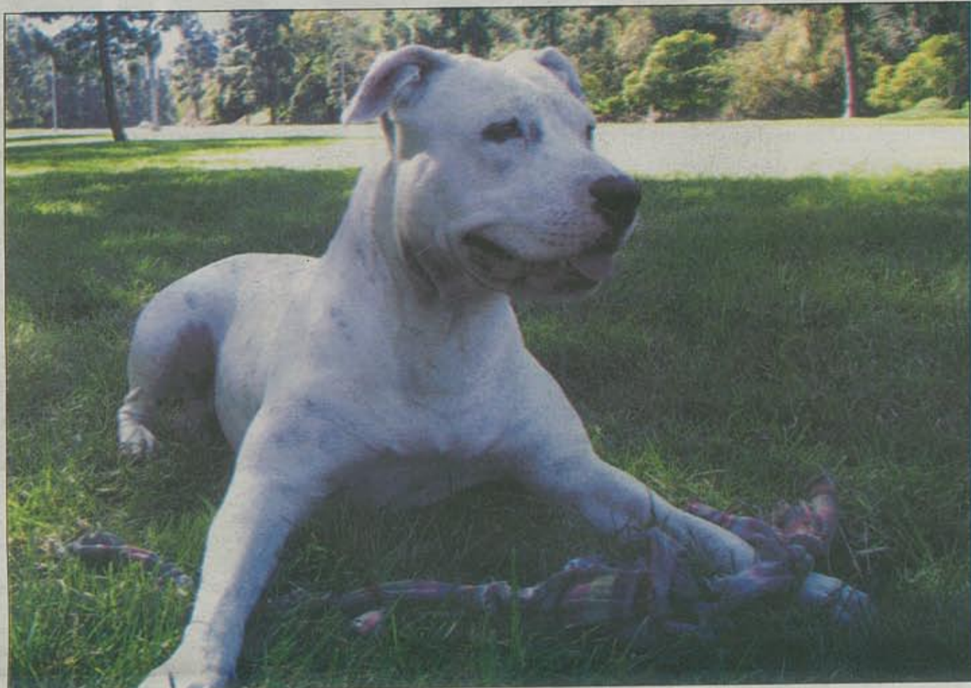
Een witte Pitbull.

moeten worden gediend, het (terugkeren van het) gevoel van veiligheid bij de burgers met betrekking tot het agressief gedrag van honden. Het veiligheidsgevoel moet in voldoende mate worden verzekerd en hier ligt de verantwoordelijkheid allereerst bij de houder van honden. De houder van honden moet te allen tijde voorkomen dat het gedrag van een hond bij anderen een onveilig gevoel oplevert. Deze verplichting laat trouwens geheel onverlet dat op de eilandelijke overheid tevens de plicht blijft rusten om zich maximaal in te spannen